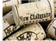
Los mejores vinos se conservan con corchos largos.

ha estado por largo tiempo en contacto con el líquido. Si el corcho huele a vino se prevé una buena degustación, se aprecia un cuidado reposo y una correcta