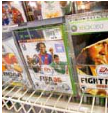
El deporte es un tema que tiene gran acogida.

oxygenación. Si por el contrario está muy seco, no es una buena señal, implica que la botella se guardó en posición vertical y probablemente el vino se oxigenó más de lo adecuado. El corcho es capaz de conservar lo mejor del vino.